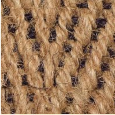
Bangalore-Laeufer - natur- braun | 2210